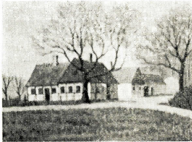
Skovfogedhuset i Fledskov